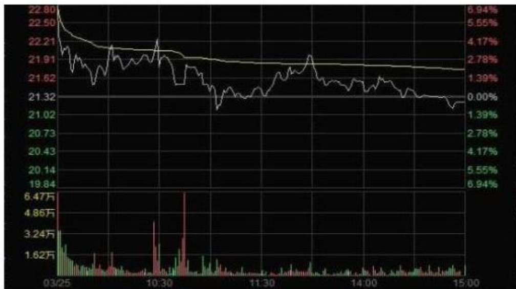
图2 3月25日“X”股价分时走势

活跃在涨停板上的操纵者和正常投资者的交易行为有明显的区别，他们在成功拉升股价后随即反向卖出，或者大量撤单以避免真实成交，反映出他们的意图在诱骗其他投资者跟风买入，而没有真实投资目的。这种行为违反了《证券法》第七十七条禁止单独或者通过合谋，集中资金优势、持股优势连续买卖，或者以其他手段操纵证券交易价格或者证券交易量的规定，构成《证券法》第二百零三